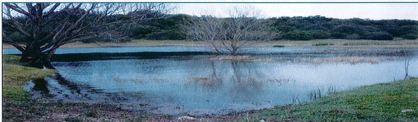
Zone humide de la Glacière/Pierre Trouée (hiver 2015)