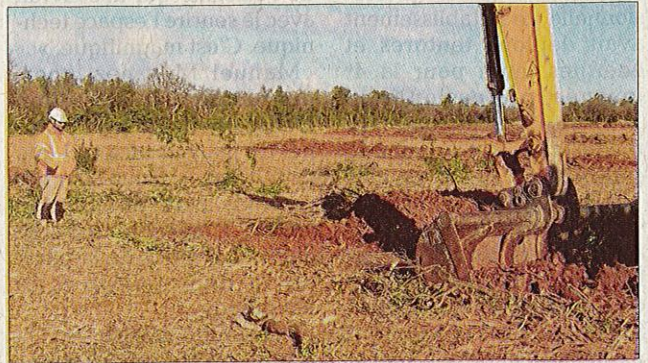
Le terrain est sondé pour rechercher d'éventuels sites archéologiques.

P etite visite ce jeudi 4 février sur le site de la future ferme photovoltaïque. Après le déboisement de la zone au mois de janvier, la seconde étape est le passage obligatoire de l'Inrap (Institut national de recherches archéologiques préventives). L'opération consiste à réaliser un sondage systématique de la zone pour rechercher d'éventuels sites présentant un intérêt archéologique. Pour cela, l'Inrap fait réaliser par une entreprise spécialisée des fossés de 3 m de large sur 10 à 15 m de long pour vérifier la présence ou non d'objets intéressants. C'est sous l'œil expert d'André Rebiscoul et d'André et Cédric Chatelier que Miguel Sevestre conduit son engin. Pour l'instant,