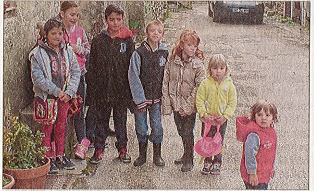
Les enfants prêts à partir à la chasse.

Il est 10 h 30 lundi quand la chasse aux œufs a été ouverte. Les parents avaient donné un sac pour collecter le maximum d'œufs. Les cloches avaient caché les œufs dans les trous des murs, les pots de fleurs, dans l'herbe... enfin dans des endroits impossibles. Heureusement, les enfants avaient l'œil pour trouver les chocolats. A noter que c'est l'association des grands (jeunes) de la commune qui avait organisé cette chasse.