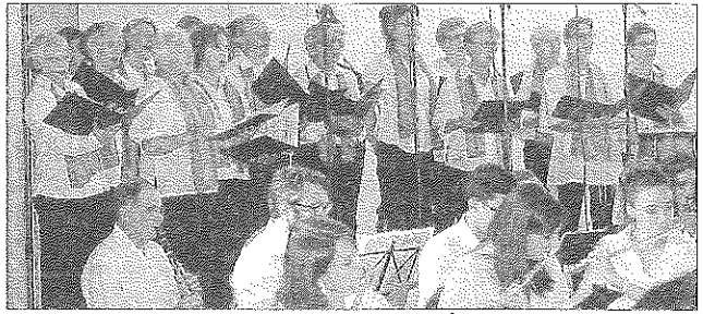
Le chœur Carrovois de Charols accompagne l'orchestre.

Nouveau à Réauville le 13 mai, l'orchestre à vents "Mistral à la clé" de Montélimar, sous la direction d'Hervé Argentin composé de 36 musiciens a offert un concert à la salle des fêtes. Il était organisé par la municipalité. Une soirée exceptionnelle, du classique, du Jazz et de grandes compositions en première partie. En prime le groupe vocal "Carrovois" de Charols, 17 cho-